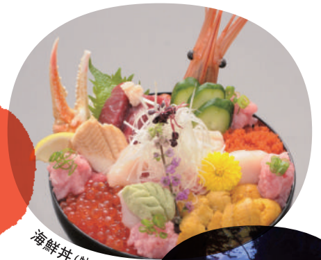
海鮮丼 (牡鹿・雄勝)