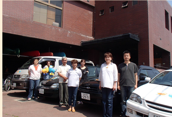
ほぼ全員地元スタッフです。車を活用した社会貢献のモデルを石巻に作ることを目指し、日々奮闘しております!(OPEN JAPAN レンタカー営業所前)

を対象にカーシェアリングによるサポートを石巻市を中心にを行っています。私たちが貸し出した車の中には、役割を終えて返却される車もあり、中には車検を目前としているもあります。その場合、車の維持費を捻出できずやむを得ず、廃車せざるを得ない状況にありました。私たちは、そんな車の維持費を捻出するために『レンタカー事業』を始めました。返却された車をレンタカー登録し、有料で貸し出すことによって維持費を捻出し、車検を通した状態で改めてカーシェアリング等の支援活動に活用していきます。また、被災地を訪れる人が年々減っていたり、地道に被災地を支援し続ける同志である団体が経済的に苦勞をしている状況も現場で見してきました。そこで、私たちは、入会金をいただく代わりに、支援団体を支援いただくとメンバー価格(半額)でレンタカーを利用できるようにしました。何度も被災地訪れていただきたい。そして支援団体を通して被災地と関わりを持ち続けていただきたい。たくさんの思いの詰まった私たちのレンタカーで被災地を巡ってください。